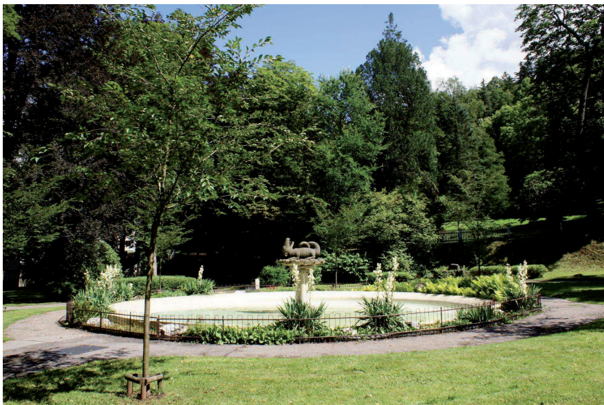
Obr. č. 8. Kamenný drak na kruhové fontáně (1792, 1903) v městském parku v Trutnově.

ho Mýta, Chrudimi a Poličky po smrti druhého jejího manžela Rudolfa I., od které doby města jmenovaná nazývaná věnnými městy, 48