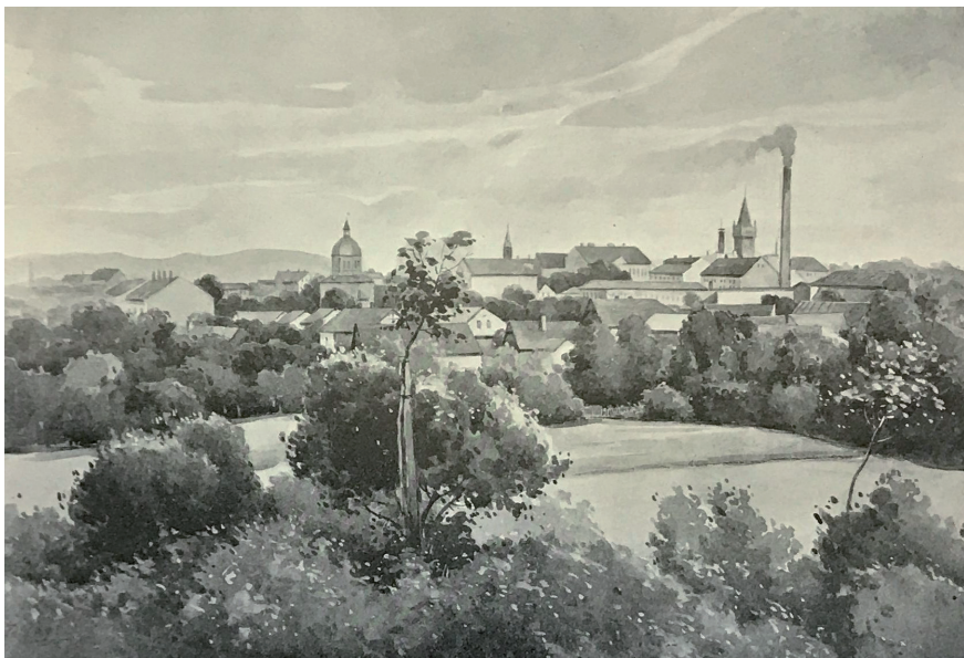
Obr. č. 3. Dvůr Králové ze Žižkova vrchu, Josef Král, 1908. In: Čechy XIV. Severní Čechy (jako pozn. 8), s. 160. – Historický ústav AV ČR. Foto Pavel Východil.

dějinný význam i novodobý pokrok, vše shrnujeme tak, aby nezůstalo utajeno nic, co zasluhuje být vyznačeno a poznáno. Pohlížíme na vlast českou s vyššího hlediska, odůvodněného dějinami vzniku přirozeného i rozvoje kulturního. 20 Svazek XV z roku 1908 věnoval Kafka střednímu Polabí, do něhož zahrnul i Královéhradecko a okolí Dvora Králové nad Labem včetně Jaroměře. 21