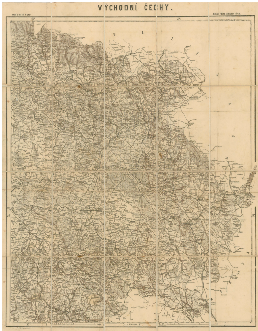
Obr. č. 1. Jan Eduard WAGNER – František KYTKA, Východní Čechy, 1 : 220 000, Praha [1881].