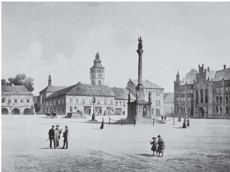
Obr. č. 4. Náměstí v Novém Bydžově, Karel Liebscher, 1908. In: Čechy XIV. Severní Čechy (jako pozn. 8), za s. 100. – Historický ústav AV ČR. Foto Pavel Vychodil.

Menší pozornost než Dvoru Králové nad Labem věnoval Kafka Novému Bydžovu, který také charakterizoval jako věnné město. Pochvalně komentoval sbírky městského muzea, založeného roku 1888. Zajímavý je pohled podle fotografie do ulice v Židovské čtvrti (srov. obr. č. 5). V průvodci se Kafka o historické instituci věnného města ani o Židovské čtvrti nezmínil. 28