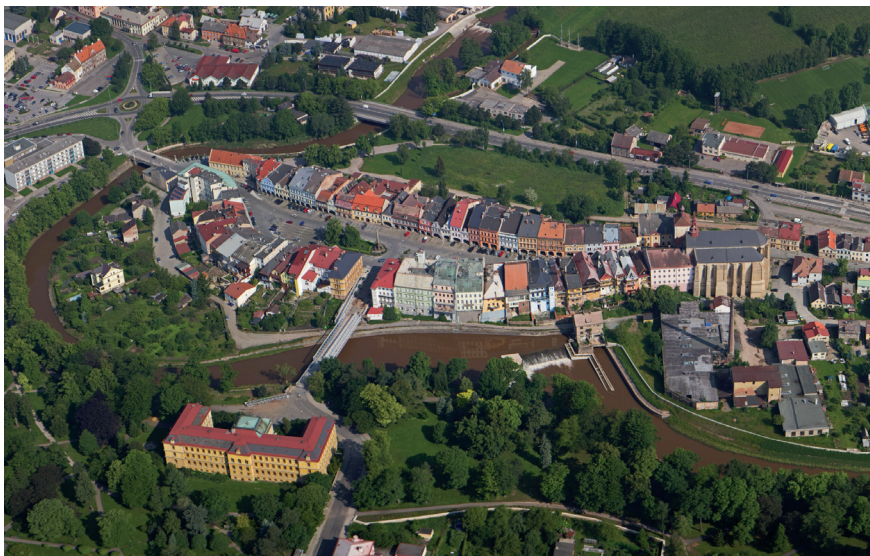
Obr. č. 12. Letecký pohled na Jaroměř; ve spodní části novorenesanční základní škola na Ostrově v Jaroměři, původně obecní budova a chlapecká škola z let 1884–1885.