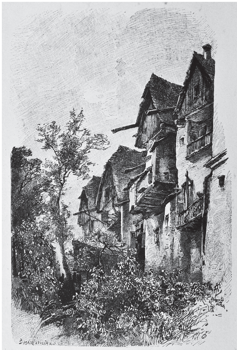
Obr. č. 11. Jaroměř, partie starých domů, Antonín Levý 1888. In: Čechy IV. Polabí (jako pozn. 8), s. 40. – Historický ústav AV ČR. Foto Pavel Vychodil.