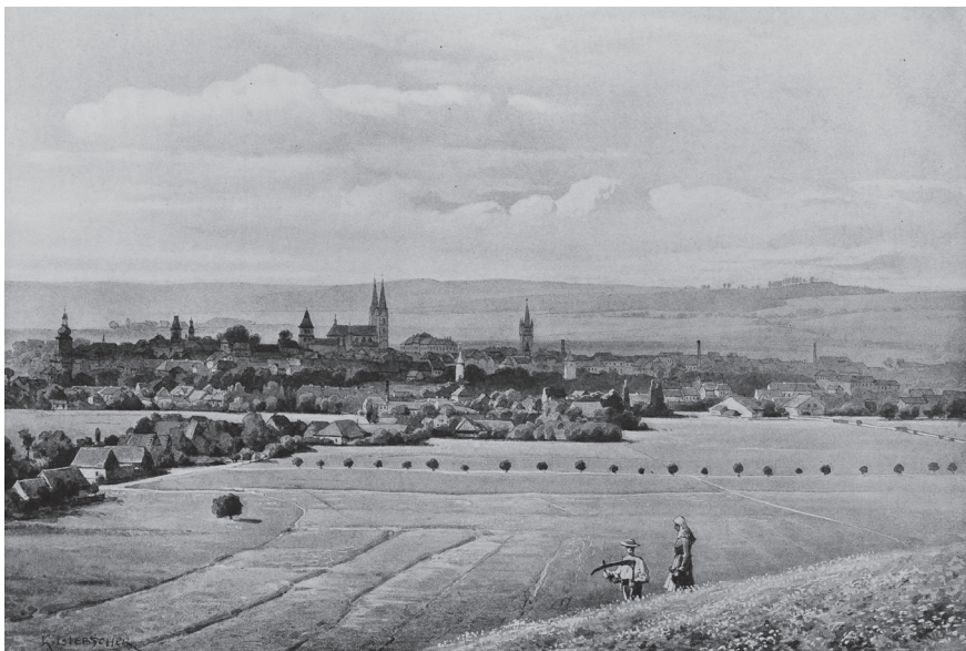
Obr. č. 7. Pohled na Vysoké Mýto z luk u Loučné, Karel Liebscher, 1905. In: Čechy XIII. Východní Čechy (jako pozn. 8), s. 199. – Historický ústav AV ČR. Foto Pavel Vychodil.

komplex kasáren, o něco později opakovalo se totéž na předměstí Pražském, které novými stavbami neustále jsouc rozmnožováno skoro již se pojí k cukrovaru a cihelnám severně od města, jež kdysi činily s domky kolem nich rychle vyrostšími zvláštní osadu. Pod Vinicemi vzniká velmi sličná villová čtvrť a tím, že hřbitov nový vybudován až za předměstím Litomyšlským, dán zajisté popud ku zastavění a zalidnění půdy dosud zemědělství věnované. Opakujeme: procházejíce se Mýtem Vysokým neustále cítíme bujný tep rostoucího života a spolu kocháme se v krásných stopách pamětihodné minulosti. 37