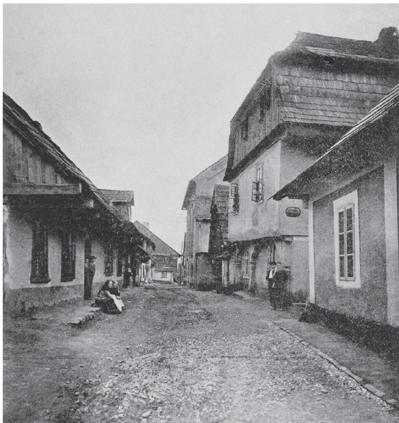
Obr. č. 5. Židovská ulice v Novém Bydžově, stav před požárem 1901 (reprodukce podle fotografie). In: Čechy XIV. Severní Čechy (jako pozn. 8), s. 99.