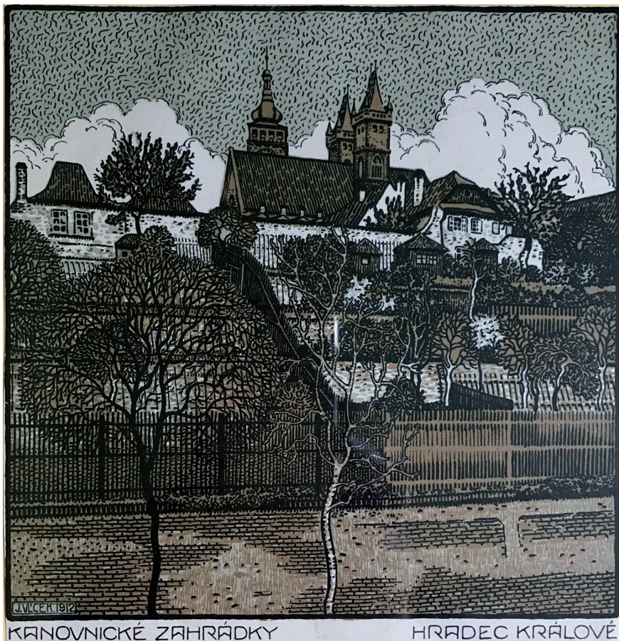
Obr. č. 9. Kanovnické zahrádky v Hradci Králové, Jindřich Vlček, barevná litografie, 1912. – Soukromá sbírka. Foto Eva Semotanová.

Ze zajímavých královéhradeckých zákoutí zmínil Josef Štolba mimo jiné „plácek Svatojanský“ (dnes vyústění ulic Rokitanského a V Kopečku před vstupem na Velké náměstí, pozn. ES), kde se podle něj již projevoval nový styl městského života: „Nejvíce tu poutá prastará kovárna, po pravici roh k sv. Duchu tvořící ... Kovárna