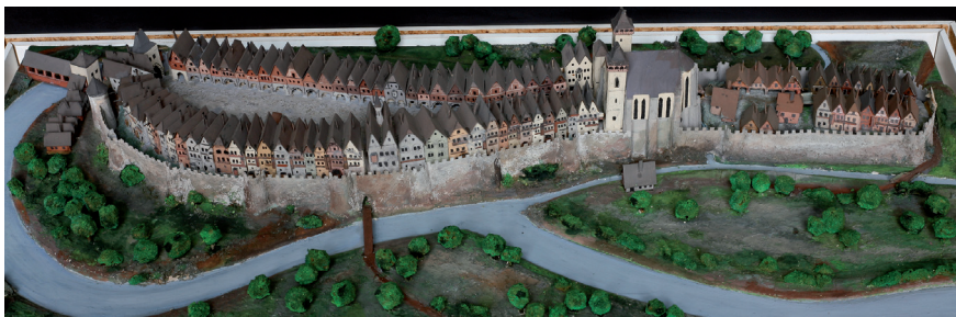
Obr. č. 1. Rekonstrukční model Jaroměře v 15. století. Dle podkladů Vladimíra Wolfa zhotovil Jiří Škopek roku 1961. Sádra, výška 390 mm, šířka 840 mm. Městské muzeum v Jaroměři, inv. č. 6024.

ni 23 (též Malé 24 ) a Zadní 25 (též Druhé 26 nebo Velké 27 ) varty, taktéž ještě opevněných prostranství, využívajících možností terénu. Součástí obranného systému se stal i kostel sv. Mikuláše, nacházející se na východní straně náměstí u druhého komplexu bran a ještě na samotném počátku husitských válek v bezprostředním sousedství kláštera augustiniánů. 28 Ochranu severní, více zranitelné strany zajišťovaly uměle navrstvené valy. Labe, které v okolí Jaroměře definitivně ztrácí podhorský charakter a přijímá podobu nížinného toku, město obtékalo od severu, přes západní stranu až k jihu a vytvářelo s pomocí několika ramen důležitou přirozenou ochranu. Jaroměřské městské opevnění tak bylo typickou ukázkou fortifikace 13. a 14. století, těžící maximálně z terénu a polohy vodních toků.