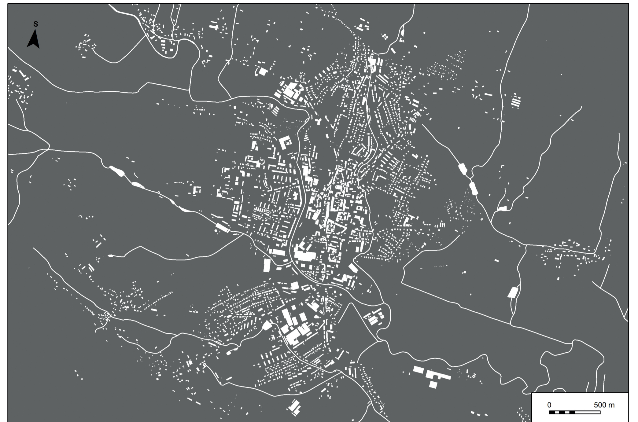
Mapa č. 35b: Negativní plán Dvora Králové nad Labem a okolí s vyznačením půdorysu města a uličních bloků počátkem 21. století s využitím soudobých digitálních dat z Geoportálu Českého úřadu zeměměřického a katastrálního